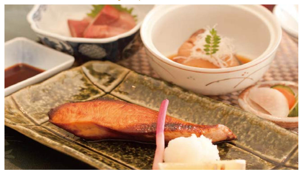
「 旬の彩り寒ブリ御膳 」