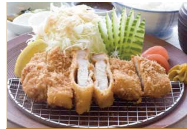
黒豚のとんかつ膳 小鉢 香の物 ご飯 味噌汁 1,900円(税別)