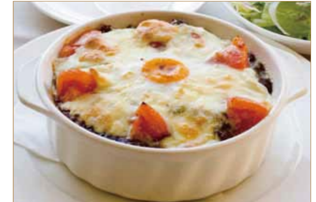
焼きカレー サラダ デザート 1,500円(税別)