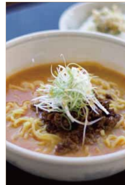
坦々麺とザーサイご飯