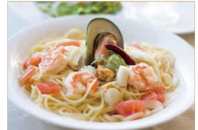
塩ペスカトーレ サラダ デザート パン 1,600円(税別)