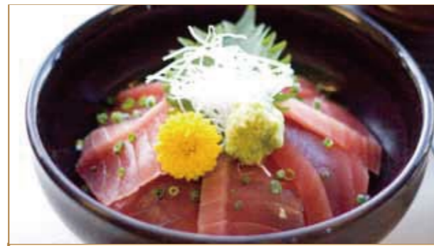
鉄火丼 小鉢 味噌汁 2,200円(税別)