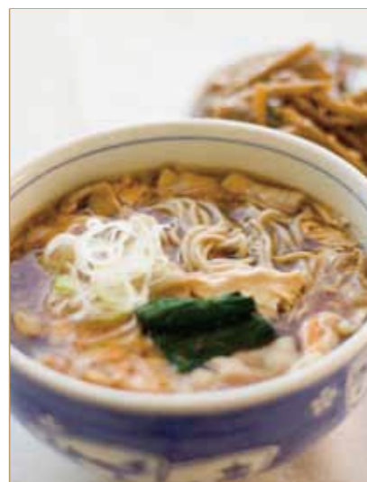
かき玉肉入りそば 鶏ごぼろ飯