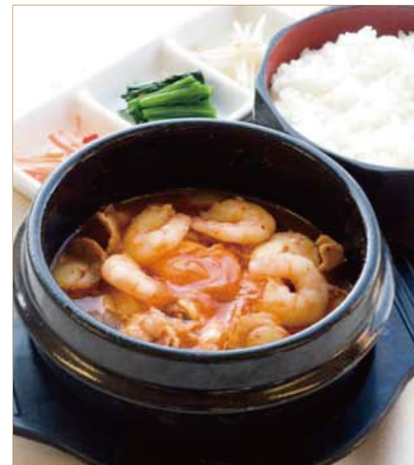
豚肉と魚介のスンドゥブ 三点ナムル ご飯