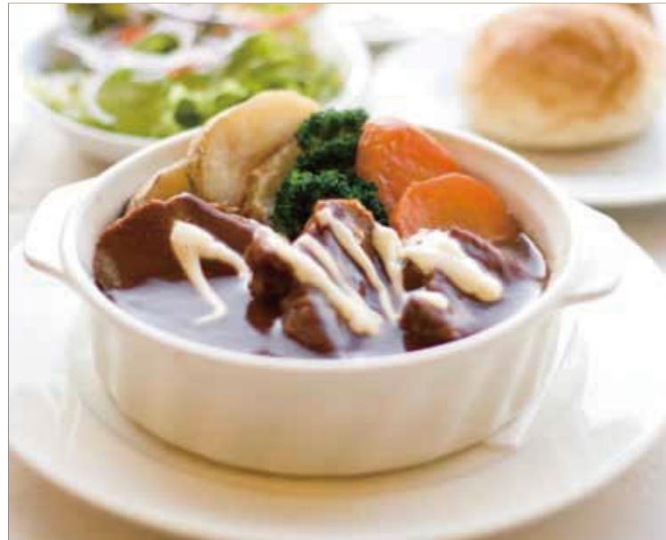
ビーフシチュー スープ デザート パン or ライス 自慢のデミグラスソースのシチューは昔懐かしい洋食屋さんの味です。